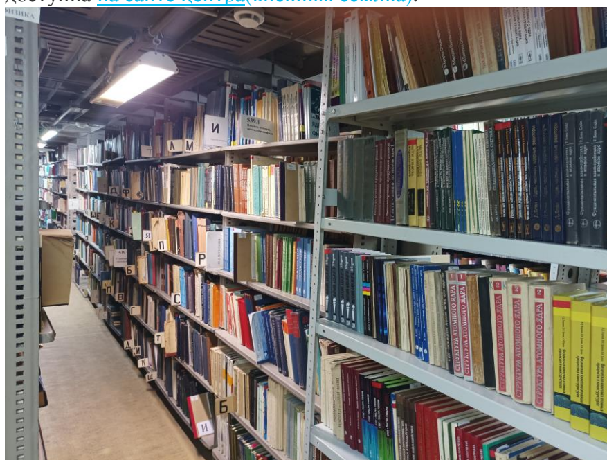
В хранилище библиотеки

издательств(внешняя ссылка) , а также издания, разработанные преподавателями университета, – как в традиционном печатном, так и электронном виде(внешняя ссылка) . Информация обо всем библиотечном фонде отражена в электронных каталогах и без ограничений доступна на сайте центра(внешняя ссылка) .