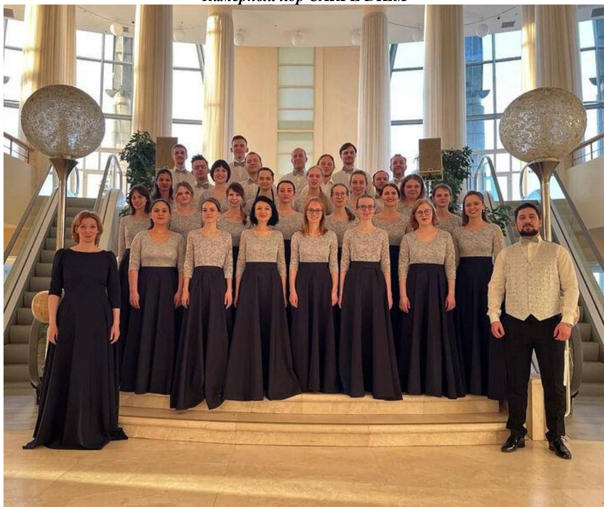
Камерный хор CARPE DIEM

Слава Мужского хора НИЯУ МИФИ росла, и студентки университета забеспокоились – девушки тоже любят петь, но ни хора, ни ансамбля, ни даже музыкального кружка для них не предусмотрено. Незачет! В 2001 году справедливость была восстановлена – для всех желающих открыла свои двери Вокально-хоровая студия, которая вскоре окрепла, выросла и стала Камерным хором CARPE DIEM, что в переводе значит «Лови момент». Кстати, волшебных моментов в жизни хора случилось немало.